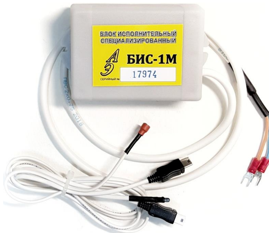
Рисунок 4 – Внешний вид блока исполнительного специализированного