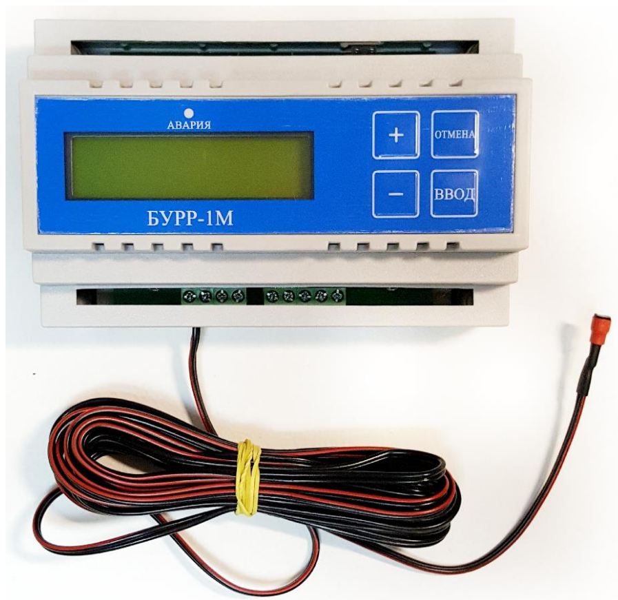
Рисунок 3 – Внешний вид блока управления ротацией и резервированием

Внешний вид изделий представлен на рисунках 3, 4.